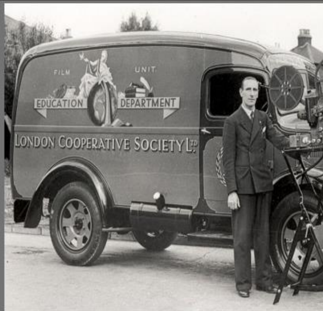
London Cooperative Society, 1914