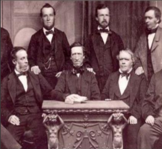
Rochdale Pioneers, 1844